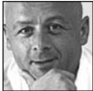
Thierry MARX, Chef étoilé du Mandarin Oriental à Paris